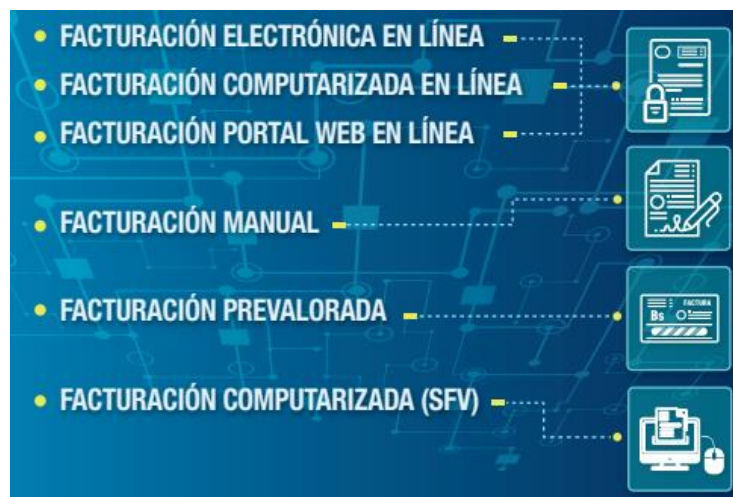
Figura N° 1: Modalidades de Facturación