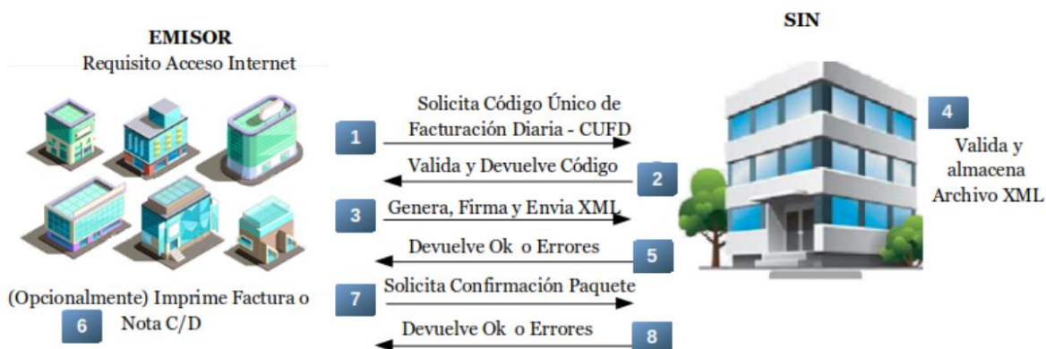
Figura N° 2: Esquema de Interoperabilidad