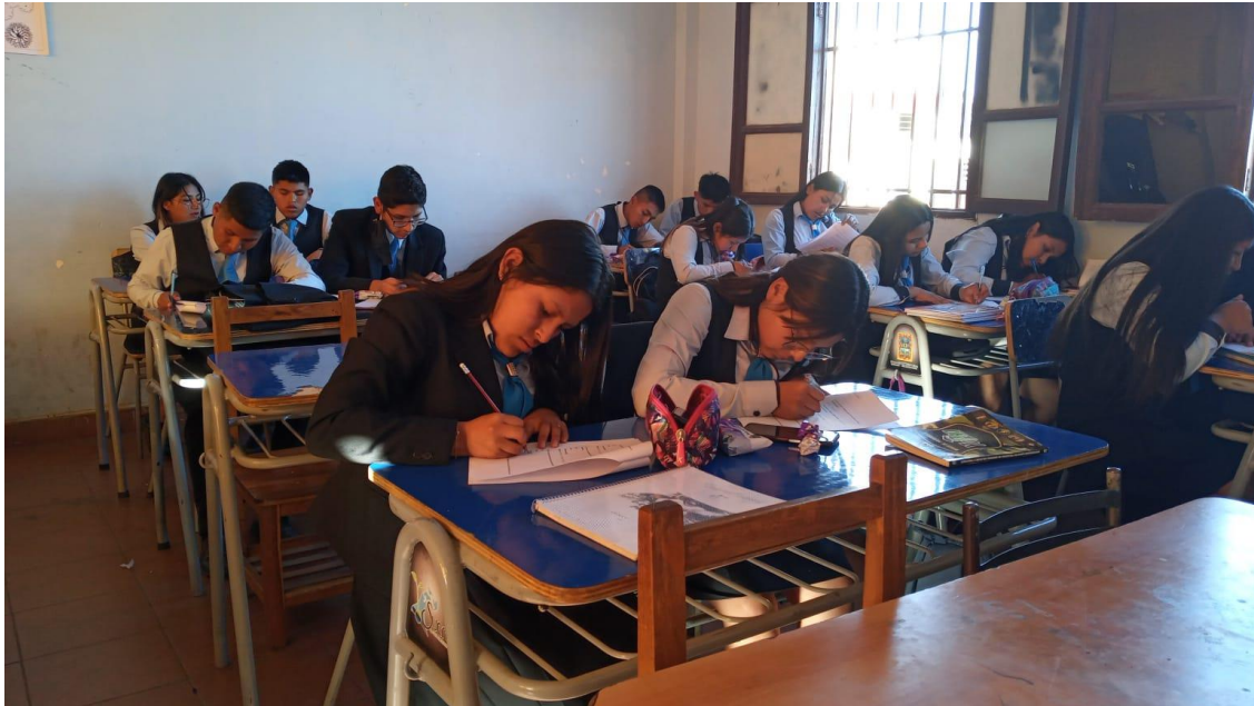
ESTUDIANTES DE SEXTO “A”, FUENTE: Imagen propia.