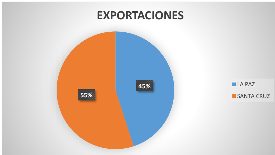
GRÁFICO N° 1: Participación Porcentual por Departamentos Gestión 2020